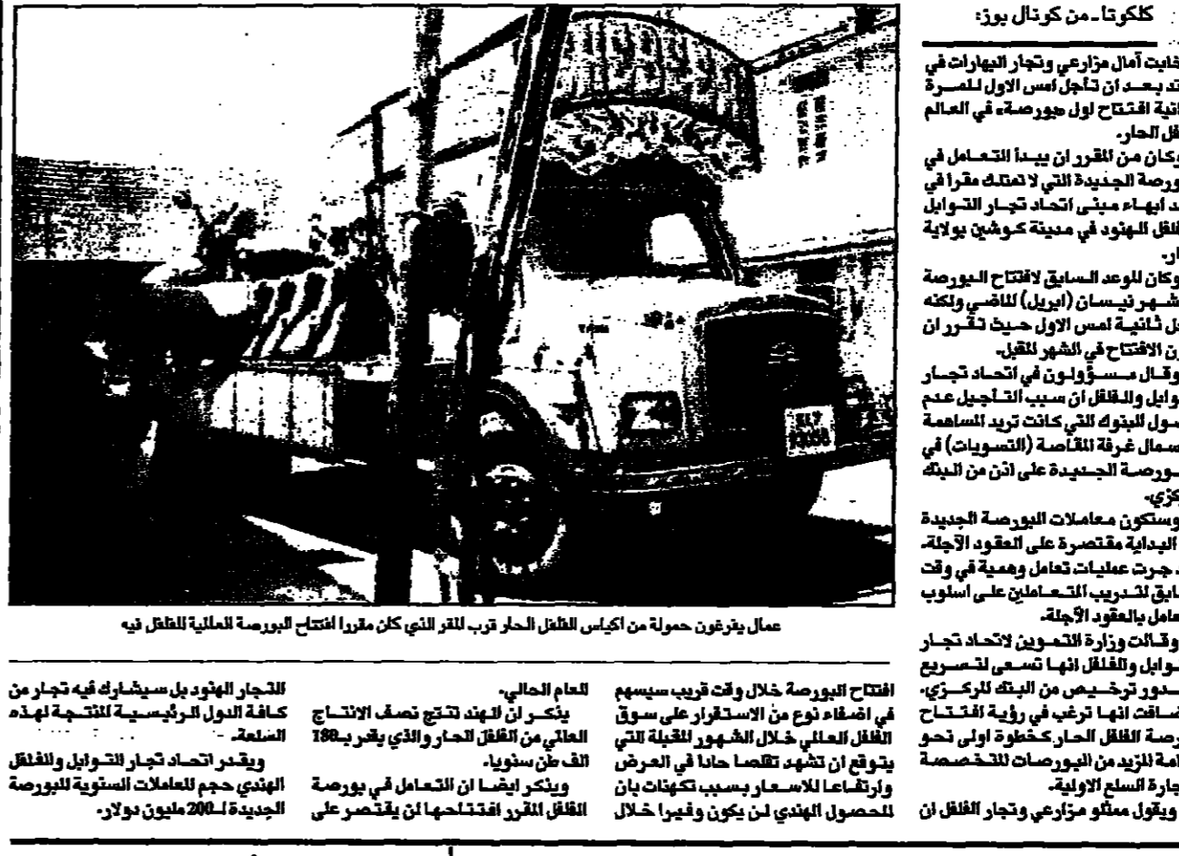
عمال يزرعون حبة من أكياس الفلفل الحار قرب القرى التي كان مقرها افتتاح البورصة العالمية للفلفل في

الهند - رويترز - قالت شركة نوردشيفيلد بترول وروبوت كورب (آي بي سي) السويدية أمس الثلاثاء إنها وشركتها ستاندرين وبيرون ستعملان في تنقيب عن النفط في ليبيا. وقال وزير النفط الليبي علي بن عبد الوهاب في بيان صحفي إن شركتي نوردشيفيلد بترول وروبوت كورب (آي بي سي) وستاندرين وبيرون ستعملان في تنقيب عن النفط في ليبيا. وأضاف أن شركتي نوردشيفيلد بترول وروبوت كورب (آي بي سي) وستاندرين وبيرون ستعملان في تنقيب عن النفط في ليبيا.